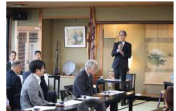
宇治橋通商店街振興組合総会

5月10日開催：今年度は、市内外から初心者や未経験者が参加する普及の部に11チーム、競技志向の高い経験者などが参加するオープンの部に17チーム、過去最多となる28チームが出場しました。青年部は「普及の部」に参加し、結果は11位で決勝には進出できませんでしたが、出場にあたり作戦を立案するなど、会員同士の親睦を一層深めることが出来ました。また、平成25年から始まった同事業に青年部のベストを着用し幾度も参加し続けたことで、地域活性化への貢献にもつながっています。