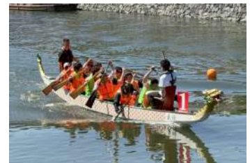
青年部 宇治川・源平・龍舟祭