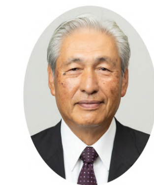
やま なかのぶ や 山 仲 修 矢 会 頭

事業計画の詳細は、宇治商工会議所 Web ページか下記二次元コードからご覧ください。