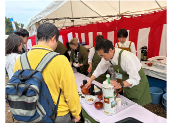
宇治茶漬け さくらまつり出店

4月4・5日開催:府立宇治公園中の島で行われた第50回「宇治川さくらまつり」に出店。4日は5店舗、5日は4店舗参加しました。会場では、日本茶インストラクターの方が一杯ずつ宇治茶の説明をしながら茶漬けを提供し、2日間で371杯を販売。多くの方に宇治茶をPRして、ご当地グルメを味わっていただくことができました。