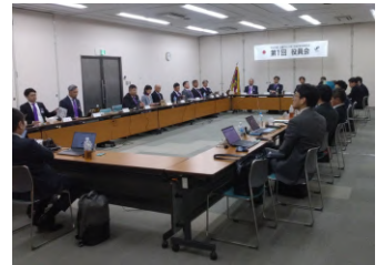
青年部 近畿ブロック役員会

4月11日開催:近畿圏内52商工会議所の青年部会員141名が宇治に集まり、役員会及び3つの委員会では、会員交流事業や近畿ブロック大会について協議しました。多くの会員が市内に宿泊し、観光をされたほか、懇親会及び二次会を市内複数の会場で実施するなど、会員間の交流だけでなく地域経済の活性化にもつながりました。