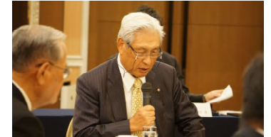
要望を行う山仲会頭