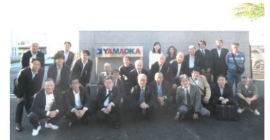
宇城久工業視察研修会

10月25日開催：宇治橋通り商店街で行われた「笑顔がいっぱいわんさかフェスタ」に3店舗が出店し81杯販売。今回は日本茶インストラクターが各商品に合う宇治茶をその場で淹れ、美味しく味わっていただきました。