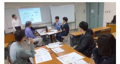
ものづくり経営セミナー