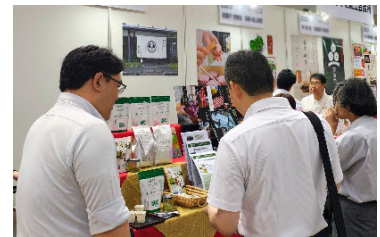
会場での商談風景