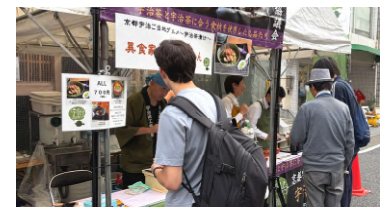
宇治茶漬け わんさかフェスタ出店