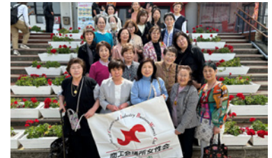
女性会 通常総会 日帰り研修会

4月16日開催：淡路島の閉校となった小学校を改装した複合施設「のじまスコラ」にて通常総会を開催。令和6年度事業として、女性経営者セミナーや老人ホーム慰問など各種事業に積極的に取り組んでまいります。総会終了後には「兵庫県立公園 あわじ花さじき」を見学する日帰り研修会を実施し、親睦を深めました。