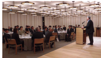
宇治観光土産品組合 総会

4月6・7日開催：府立宇治公園中の島で行われた第48回宇治川さくらまつりに3店舗がPR出店。宇治茶漬けコーナーにて206杯を販売し、多くの方にご賞味いただきました。