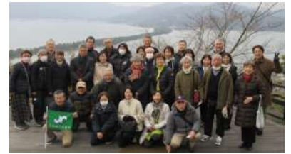
会員サービス事業

3月6日開催：穏やかな伊根湾を周遊する伊根湾めぐり遊覧船の乗船や、天橋立を逆さまに見ると、天にかかる橋のように見えることから股のぞき発祥の地として知られている天橋立傘松公園の散策、カニづくしの昼食やお買い物を楽しんでいただく日帰りツアーを開催しました。普段見れない舟屋の情緒あふれる美しい景色やカニ料理を堪能しながら、会員相互の親睦交流を大いに深めることができました。30名参加。