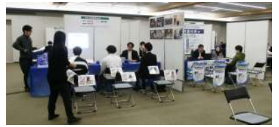
宇治市ものづくり企業合同企業説明会

3月7日開催：市内製造企業の人材確保を支援するため、今春および来春の大学等卒業予定者や既卒者を対象にした「ものづくり企業合同企業説明会」を京都経済センターにおいて開催しました。参加企業からは、「製造業に興味がある方が来られるので、求職者数は少ないが、マッチング成立の可能性が高く、期待が持てる。」「採用したい人材に出会えたので、次回も参加したい」との声がありました。参加企業20社、求職者14名。