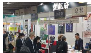
スーパーマーケット・トレードショー出展