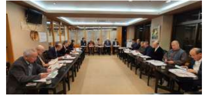
東宇治地区委員会

2月28日開催：東宇治地区の動向についての情報共有や会員増強運動等について協議しました。17名参加。