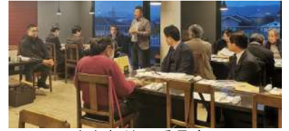
大久保地区委員会

3月1日開催：大久保地区の動向および近隣市町等の状況について情報共有し、地元選出議員との意見交換会を実施。また、第24回チャリティゴルフコンペおよび会員増強運動等について協議しました。22名参加。