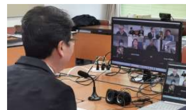
米国日系スーパーとのオンライン商談会