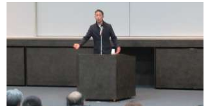
青年部 森脇健児氏講演会

2月7日開催：森脇健児氏(松竹芸能株)を講師に招き『試練を乗り越えて～始めの一步 新たな一步 共に成長しそして未来へ～』をテーマに、会員事業所や京都府内商工会議所青年部会員を対象とした講演会を開催。ご自身の体験談を中心に、現在の芸能界での活躍に至るまでの経緯や自身の行動についてご講演いただきました。参加者からは、「変化する社会でも自企業の発展に向け、準備や努力を怠らずに企業活動を行う大切さを再認識した」等の意見がありました。80名参加。