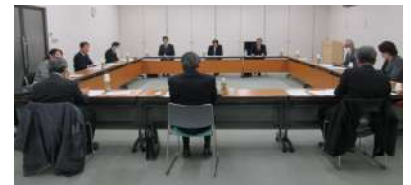
榎島地区企業街づくり協議会 懇談会