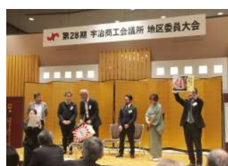
抽選会 各地区正副委員長