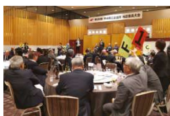
正副会頭を知り尽くせ!ゲーム