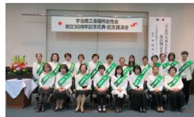
令和5年度女性会役員