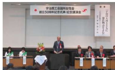
祝辞をのべる山仲会頭