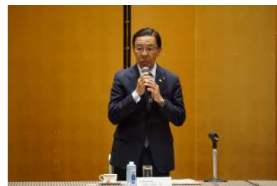
挨拶をする西脇知事