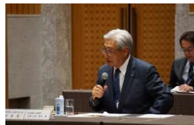
要望する山仲会頭