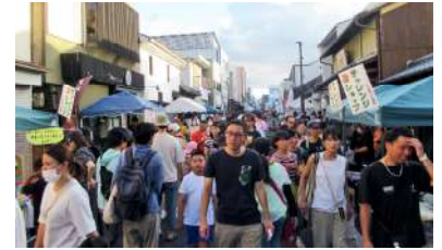
多くのご来場で賑わう商店街