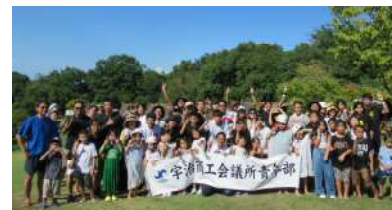
青年部 家族親睦 交流会

8月20日開催: 交流委員会では、YEG活動への意欲向上、メンバー間の交流を目的にBBQ交流会を開催。メンバーのご家族様にもご参加いただき、うなぎ掴みゲーム等のレクリエーションを通して親睦を深めました。参加者60名。