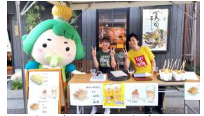
加盟店のグルメ販売ブース

夏の宇治の恒例イベントとして年々認知度も高まる中、当日は、地元住民だけではなく、近隣府県や関東方面からのご来場も増加し、昨年を大きく上回る約 1 万 5 千人(昨年約 1 万人)の人出で賑わいました。