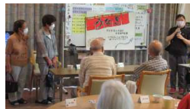
女性会 うなぎの慰問

7月28日開催: 菟道明星園と白川明星園へ「うなぎを食べて猛暑を乗り切ってください」と今年も土用の丑にちなみ、うなぎ90匹分の蒲焼をプレゼントしました。コロナ禍で2年振りの訪問となり、久しぶりに直接ご挨拶することができ、利用者の方々に喜んでいただけました。