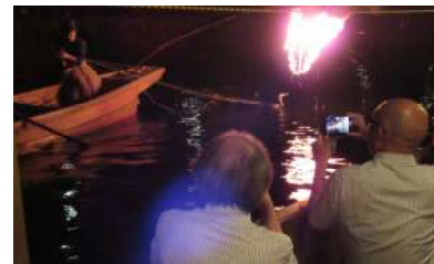
かわせみの会 撮影会

8月3日開催: 「宇治川の鵜飼 撮影会」を開催しました。装束に身を包んだ女性鵜匠の巧みな技や、躍動感ある鵜の魚を取る様子を水面に映るかがり火と共にカメラに収めておられました。参加者10名。