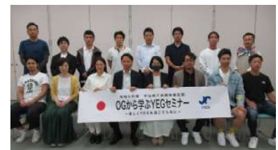
青年部 OGから学ぶ YEG セミナー

5月30日開催：会員拡大委員会では、令和4年度以降に入会したメンバーを対象に青年部活動についてのセミナーを開催。OGをゲストにお招きし、座談会形式で宇治YEGの組織や活動について説明され、理解を深めるとともに、ゲームを通じてメンバー間の交流も図りました。