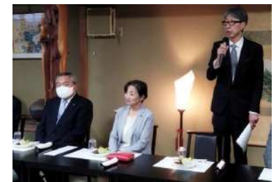
宇治橋通商店街振興組合 総会

5月24日開催：今年度は「面白いを創造する商店街(まち)は、来たい、住みたい商店街(まち)になる」を活動方針に、近隣商店街・関係機関との連携強化を図り、地域の暮らしを支えるプラットフォームとしての商店街づくりに取り組みられます。夏の感謝セール、秋のわんさかフェスタの充実と共に、本年はスマートフォン位置情報を活用したイベントも開催予定です。