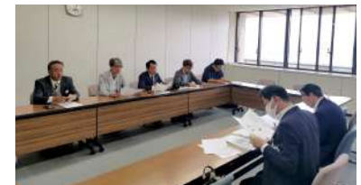
トビケラ対策に関する市へ要望

5月25日開催：宇治橋周辺の4商店街団体及び周辺自治会は、今春からのトビケラの発生状況は例年以上であり、post コロナを迎え活気が戻りつつある中で、観光客の宇治に対する印象低下に留まらず、周辺住民や事業者にも多大な影響が出ていることから、現状の把握と対策の見直しを求める「トビケラ対策の強化に関する要望書」を宇治市へ提出されました。宇治市では、今年度、薬剤散布の実施回数を増やすなど対策を講じられておりますが、「継続的な対策に努めるとともに、より効果的な対策の検討など団体等との情報交換の場を今後も設けていきたい」との声をいただきました。