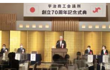
式辞を述べる山仲会頭

対象従業員 令和 5 年 4 月 1 日現在で、勤続年数が 20 年・30 年・40 年の方 (家族従業員は除く)