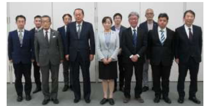
槇島地区企業街づくり協議会

2 月 7 日開催：OB および現役会員間の交流や意見交換を目的に 3 年ぶりに開催。現役会員からは、今年度の各委員会事業を報告。OB 会員からは、現役時代の経験や想いを語っていただき親睦を深めました。31 名参加。