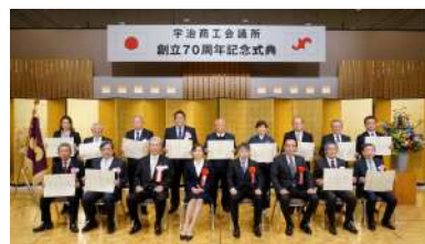
京都府知事表彰 受賞者