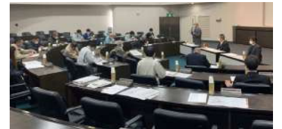
宇治川改修対策特別委員会

2 月 13 日開催：松村宇治市長をお迎えし、懇談会を開催。参加者からは「価格高騰や円安の影響により利益確保に苦慮している」といった経営課題の報告や交通インフラの整備、産業立地計画の進捗状況等について質問され、松村市長からは感想も交えながらご回答いただきました。8 名参加。