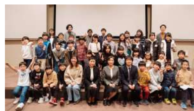
プロジェクト発表者とゲスト

宇治NEXTでは、小学3年生から中学3年生を対象に、社会との繋がり方を身につけ、共に社会に挑戦するスクールを開催。未来を担うこども達が今後、多様な働き方を選択し、挑戦できる体験を提供しました。昨年6月の開始から、第22回目となる2月11日(土)に生涯学習センターにて、16組34名のこども達が実施した「宇治市をちょっとよくするプロジェクト」を発表しました。来場された保護者や学校関係者等104名の前で、「Pepperが外国人観光客に観光案内するプログラム」、「商品を製造し販売して得た売上を市内介護施設や動物病院などに寄付、または必要とする物を購入し寄付する事業」などを報告。会場では、宇治市長や教育長を含む4名のゲストに講評いただき、市長から「皆さんの、誰かの為に何かをしようという気持ちや行動が、宇治の方々を感動させ、宇治が良くなる」との感想をいただきました。