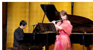
フルートとピアノの演奏

当商工会議所ホームページ内に創立 70 周年記念特別ページを開設いたします。下記 QR コードから是非、ご覧ください。