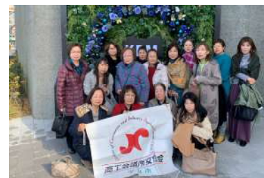
女性会 日帰り研修会

12月13日開催：会員企業の研鑽並びに企業間交流を図ることを目的に、日帰り研修会を神戸方面にて開催。アクアリウムとアートが融合した新感覚の都市型水族館「アトア」を見学した後、「神戸ポートピアホテル」にて、親睦会を行い、交流を深められました。