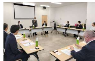
みえ熊野古道商工会での研修

三重県南部の紀北町商工会と御浜町商工会が2市を挟んで全国初の飛び地合併を行った「みえ熊野古道商工会」では、外国人技能実習生共同受入事業について研修。地元水産加工業者等の深刻な人手不足の状況から平成14年に立ち上げ、中国・ベトナム・ネパールから計415名を受け入れる中、監理団体として文化や習慣の違う実習生と地元事業所との調整にかかる苦労や自治体との連携の重要性について学びました。また紀北町の道の駅「紀伊長島マンボウ」や三重県多気町にある日本最大級の商業リゾート施設“VISON”の視察を行い、有意義な研修となりました。