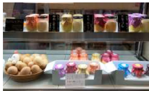
「ただなり宇治プリン」

より多くの消費者に自社の卵を食べていただきたいという想いのもと、宇治の新しい手土産となることを目指し、試行錯誤の末、令和2年には山城地域で初となる平飼い養鶏場が作る新たな産直スイーツ「ただなり宇治プリン」が誕生。宇治橋通り商店街の大阪屋マーケット内の店頭及びインターネット