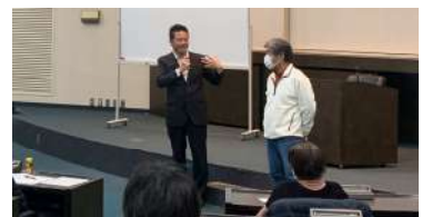
女性会 経営セミナー

1月18日開催：役員会を開催し日帰り研修会(2/17予定)の中止を決定。その後、夏川立也氏を講師に招き、経営セミナー「面白いほど話が弾む会話術」を開催。言葉に感情を込めるワークショップを交え、どのように会話すれば相手に伝わりお互いの距離を縮められるか解説いただきました。