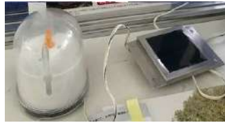
工事不要の蠟燭型自動電灯