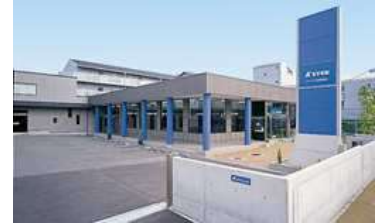
エーシック株式会社

平成4年3月設立。宇治市に本社を構えるLEDメーカー。製品の開発・設計・製造・販売まで一貫して行い、アイデアを組み込んだ高品質なものづくりをされています。