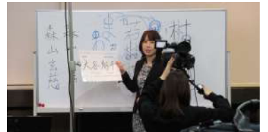
青年部 筆跡診断セミナー

1月25日開催：筆跡診断士の3名を講師に招き『“字”で広がる可能性～筆跡は心の鏡～』をテーマに京都府内商工会議所青年部会員を対象にWeb配信にて講演会を開催。深層心理学や統計的データをもとに分析を行う筆跡診断について解説いただき、それぞれの筆跡を診断していただきました。参加者からは、「自身の性格や特徴を再認識する良い機会となりました」等の意見がありました。