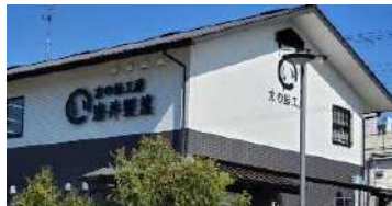
株式会社岩井製菓本社

社長に転機があったのは、営業先のお客さんから「会社、宇治にあったんだ！」という一言。これをきっかけに、宇治が持つ知名度とブランド力に気づき、「宇治なんて」という考え方を改め、現在は宇治ブランドを大切に、宇治を前面に押し出した“宇治茶飴”や“贅沢抹茶飴～碧の極み～”を製造するに至りました。「宇治だから」を強みと捉える岩井社長の瞳はらんと輝いておられます。