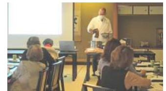
女性会 食の意義探求セミナー