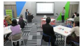
うじらぼ 1周年記念イベント

11月19日開催:宇治市産業会館1階「うじらぼ」では、開設1年を迎えるにあたり、この施設を知っていただき、さらに事業者や起業家等の利用者を増やすことを目的に、参加者が気軽に今後の行いたい事業を発表し意見交換を図る記念イベントを開催。当日は、グループワークで取り組み内容をブラッシュアップ。その後の交流タイムでは、打ち解けた参加者同士が活発に情報交換をされ、交流の輪を広げられました。17名参加。