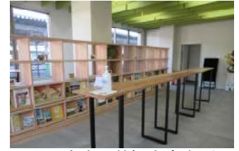
JR宇治駅前観光案内所