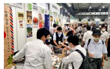
東京ビッグサイト「食の逸品 EXPO」

10月6日～12日の期間、米国・ハワイ州の「マルカイホールセールマート」にて京都フェアを WITH コロナの環境下に対応したセルフ販売形式にて開催。同フェアにはバイヤーの目になかった20メーカー115品(取引額約340万円)が採用され、好評を博した商品は今後の定番化や、需要の高まるシーズンに合わせた追加オーダーが見込まれ、引き続きの商談を継続していきます。