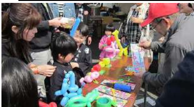
2017年 第2回オグザニアの様子

商店会が主催する代表的なイベントには「オグザニア」と「オグマニア」があります。オグザニアは、大工の棟梁や災害派遣医療チームなどの職業体験ができる「職」と地域の飲食店が出店する「食」をテーマに親子で楽しめる地域振興イベントです。