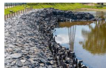
復元された宇治川太閤堤