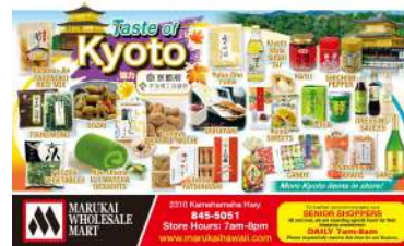
米国・MARUKAI「Taste of Kyoto」