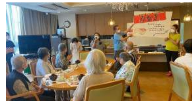
女性会 老人ホーム慰問

7 月 14 日開催: 絆づくり委員会では、辰巳屋にて「YEG セミナー」を参加者 28 名で開催。入会歴の浅いメンバー向けに、動画やクイズ形式で宇治 YEG の組織や活動内容を中心に説明を行い、YEG 活動について理解を深めるとともに、メンバー間の交流を図る取り組みとなりました。