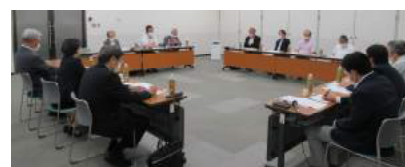
◆7/12：山仲会頭・小山副会頭、商業・茶業・観光・文化部会の正副部会長 計12名参加

7月20日の懇談会では、「受注先が在宅勤務でライン稼働率が下がり、部品納入が減少」(工業)、「ウッドショックで木材調達が厳しい」(建設)、「外出減の影響で事故も少ないのか钣金需要が減少」(交通)、「建設業が厳しく融資先の3割を占める」(金融)などの経営課題が挙がり、両日とも松村市長はそれぞれの部会からの意見に感想を交えながら熱心に耳を傾けておられました。