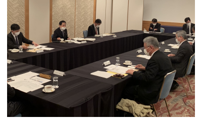
京都府商工労働観光部長との懇談会