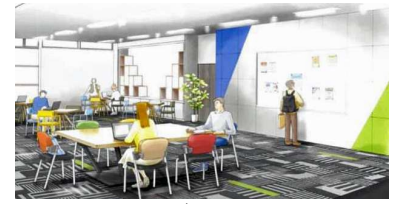
『うじらぼ』イメージ図

『うじらぼ』は、市内企業の製品展示を行っていた産業情報コーナーを一新、コワーキングスペース、イベントスペース、情報発信スペースの3つの空間で構成されます。宇治市産業戦略のコンセプト「広がる、生まれる、進化する“産業交流都市・UJI”」の実現に向け、様々な人の交流を通して、新たなアイデア・事業・商品・働き方等の新しい価値を生み出す空間を目指します。テレワークやミーティング、研修、イベントなどお気軽にご利用ください。