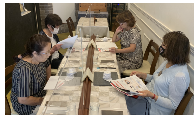
女性会 正副会長会議

10月28～29日開催：美しく木々が色づいた新穂高周辺をはじめ、朝もやの立ち込める上高地と合掌造りの白川郷において撮影会を行いました。