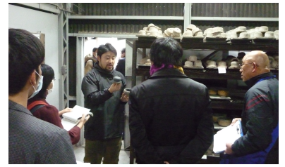
デザインウィーク京都 in 宇治

デザインウィーク京都 in 宇治 ：2月23日～3月1日開催 人と人が繋がることで新たなイノベーションや協業を生み出すことを目的に、モノづくりの工房や工場を一般開放する見学会を実施。市内企業7社を効率的に巡ってもらうため、5つのツアーを企画した。