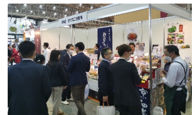
スーパーマーケット・トレードショー

両展示会でも、新型コロナウイルスの影響により、例年よりも来場や試食を差し控えるバイヤーも数多く見受けられましたが、出展各社の熱心な商品提案により、見積依頼やサンプル依頼など約500件の名刺交換が行われ、新規取引獲得に向け、引き続き継続商談に取り組まれています。