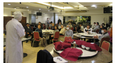
宇治公衆衛生協会宇治支部 研修会