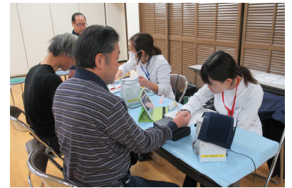
榎島地区 健康診断

12月3日・4日開催：榎島地区企業街づくり協議会と共催で、京都工場保健会の協力のもと榎島コミセンにおいて健康診断を実施。榎島地区の会員事業所を対象とし、22事業所122名の方が受診されました。