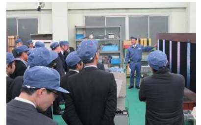
工業部会 星和電機視察

12月10日開催：宇治・城陽商工会議所と久御山町商工会の工業部会員21名が宇城久区域でのネットワークづくりのため、広域連携合同研修事業として、久御山町で美容室向け頭髮化粧品などを製造する「コタ株式会社」と、城陽市にて道路の情報表示システム、防水や防爆各種特殊照明機器などを製造する「星和電機株式会社」を視察しました。その後の懇親会において情報交換を行い、交流を深めました。