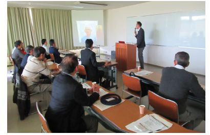
事業承継セミナー

12月12日開催：経営者と後継者のスムーズなバトンタッチと、円滑な事業承継に不可欠な遺言書や相続について、事例を交えて解説されました。13名参加。