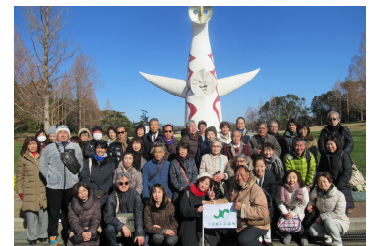
会員サービス事業 太陽の塔前

1月28日開催：塔の島改修工事の進捗状況や施工スケジュール、導水路等の景観対策、塔の川左岸工事用道路撤去方針、府立宇治公園上面整備計画について協議を行いました。