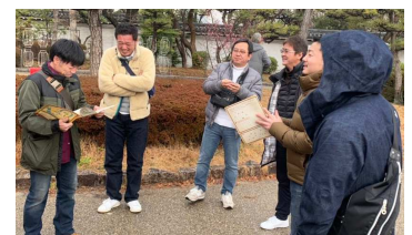
謎解きに挑戦する青年部部員