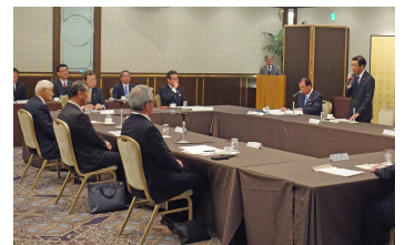
府内会頭に挨拶する西脇知事

京都市に集中する観光客を府全域に広く周遊させ、観光消費額の拡大を図るため、京都市及び府域の市町が連携した観光周遊ルートづくりの強力な推進