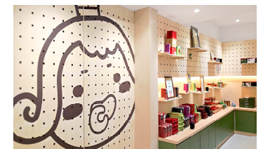
公式ショップの様子