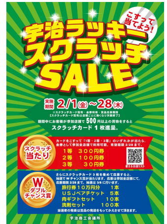
参加店舗に掲示されるポスター

参加店舗が掲示する、このポスターを目印に「宇治ラッキースクラッチ SALE」でのお買い物をお楽しみください。