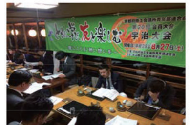
宇治商工会議所青年部