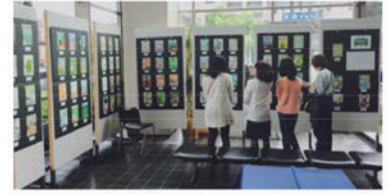
入賞作品を熱心に鑑賞する来場者

販売茶店 (株)伊藤久右衛門、(株)お茶のかんばやし、(有)上林春松本店、(合)北川半兵衛商店、共栄製茶(株)、(株)松北園茶店、(株)通圓、(株)辻利一本店、(合)芳春園岩井勘造商店、(株)堀井七茗園、(株)丸久小山園、(株)山政小山園 (50音順)