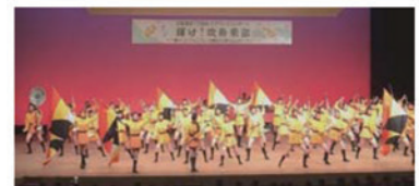
京都橘高校のマーチング演奏

同日開催の「ガイド付きスペシャル探訪ウォーク」には、定員60名を超える80名が参加し、また、アニメの舞台となった巡礼地を訪ねる「スペシャル1dayスタンプラリー」には、760名が参加され朝早くからスタンプ台に行列ができました。各スポットでは、記念撮影をされる姿が見受けられ、宇治市内は、終日大勢の人々で賑わいました。参加者からは、「宇治の新たな魅力に気づくことができた」などの感想をいただきました。