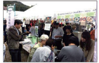
宇治茶漬け販売ブース

宇治商工会議所では、4月2日(土)、3日(日)の2日間開催された宇治川さくらまつりに、「京都宇治ご当地グルメ～宇治茶漬け～」をPR出店しました。当日は、「宇治茶漬け」取扱店10店が販売ブースに軒を連ね、朝から訪れられた多くの来場者に、各店舗趣向を凝らしたこだわりの一杯を販売されました。初のイベント出店でしたが、好評で早々に完売した商品もあり、2日間で768人前を販売しました。購入いただいた観光客や市民の方からは「さっぱりして美味しい」、「たくさん種類があっておもしろい」などとお褒めの言葉もいただき大盛況のうちに終了となりました。