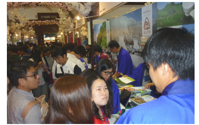
タイ国際旅行博の出展ブース

宇治商工会議所では、タイからの観光誘客を図るため、宇治市、観光協会、京都山城地域振興社(お茶の京都DMO)と連携し、バンコク市内で開催された「タイ国際旅行博2018」において、PRブースを出展し、「オール宇治体制」で観光プロモーションを実施しました。「タイ国際旅行博」は、2月7日から5日間に渡り、旅行会社や航空会社が来場者に直接旅行商品を販売する国際観光見本市で、期間中の来場者数は約50万人で、日本からも多くの自治体や企業がPR出展しました。タイでは、4月中旬にソンクランという大型連休がある為、海外旅行を計画する人が大勢来場されました。宇治市ブースでは、宇治茶や宇治の観光スポット、京都の交通網について熱心に質問されました。また、2月9日には現地メディアやウェブサイト制作会社、旅行代理店等を訪問し、観光セールスを実施しました。タイは、スマートフォンの普及率が70%と高く、フェイスブックやインスタグラムの利用者数も大きく伸びていることからSNSを活用した観光PRの方法について意見交換を行いました。