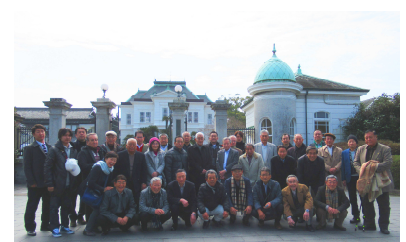
役員議員研修旅行

2月23・24日開催：35名参加のもと福岡県博多方面へ1泊2日の役員議員研修旅行を実施。2017年に世界文化遺産登録認定された宗像大社や菅原道真公を祀る大宰府天満宮を参拝。柳川では北原白秋生家の記念館や国指定名勝である立花氏庭園を見学し、どんこ舟で水郷を回る柳川堀巡りを体験。