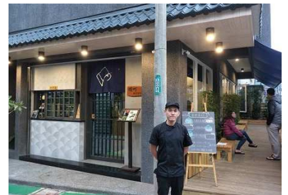
緑町抹茶専門店とオーナー