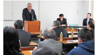
交通部会情報交換会

2月2日開催：第一部では宇治警察署より管内情勢と交通安全対策について講演いただき、第二部では日野自動車株式会社技術研究所より、バスの先進安全技術と自動運転に向けた取り組みについて学んだ。38名出席。