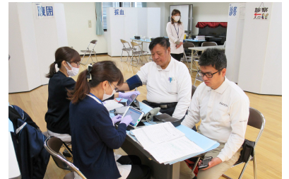
榎島地区委員会 健康診断