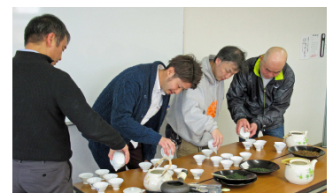
宇治茶漬け協議会