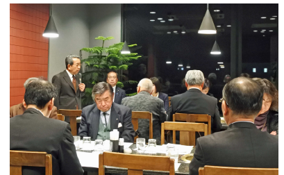
大久保地区委員会