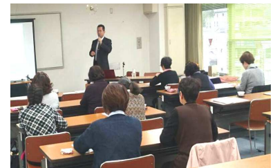
講演会を聞かれる女性会の皆様