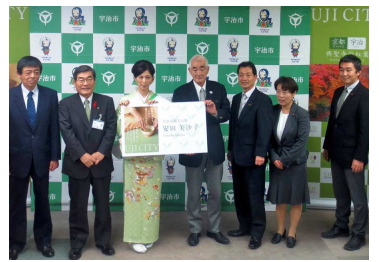
宇治市観光大使 就任式