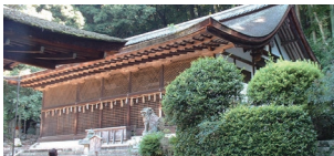
世界遺産 宇治上神社 宇治上神社の本殿や拝殿は、1000年以上存続されており、日本最古と言われています