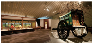
宇治市源氏物語ミュージアム 宇治は源氏物語の舞台。宇治市源氏物語ミュージアムは、華やかな王朝文学の世界を体感できます