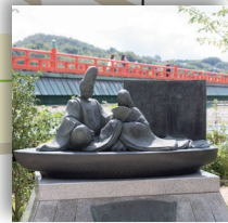
宇治十帖モニュメント