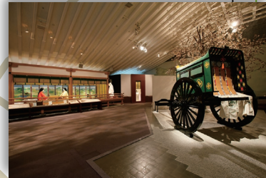
宇治市源氏物語ミュージアム