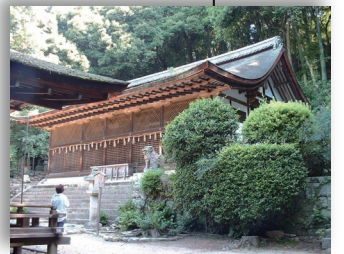
世界遺産 宇治上神社