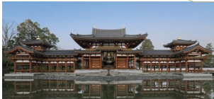
世界遺産 平等院 平等院は、昨年に鳳凰堂の「平成の大改修」を終え、創建時の姿に最も近付いています

お茶の本場として全国的に有名な宇治。宇治川の兩岸には世界遺産に指定される神社仏閣。そして秋は紅葉が美しく彩る山並みなど、京都でも特に風光明媚な観光の名所です。