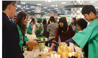
試食販売コーナー