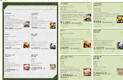
<メニュー&プライスカード見本>