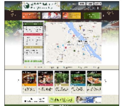
店舗紹介サイトTOPページ(仮)