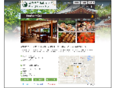
店舗個別ページ(仮)

公開は12月を予定しており、今回、同サイトへの掲載希望店を募集します。掲載にあたり、紹介内容等の素材提供のご協力をいただきますが、翻訳および店舗ページ制作、掲載費用等すべて無料としておりますので、ぜひこの機会にご応募ください。