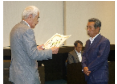
功労事業所表彰を受ける 平和住宅建設(株)

功労事業所 商工会議所の会員として25年以上在籍する事業所 美容室ドルチェ、鳥料理さいとう、(有)植村ガーデン、すしまさ、(株)智光 松栄金属(株)、京のきものさらさや、ワーゲンショップキタガワ、(株)明清 インテリア創苑、(株)山口屋穀粉、塚本工業(株)、ミキモト化粧品友恵営業所 平和住宅建設(株)、コーヒーショップきはち、パナコン塾とんがり山教室 田中青果店、カラオケパブ信子、(株)中瀬鐵工所、本多産業(株)、山貴交易(株) 山根寝装店、オングル工芸(株)、三信衣料宇治小倉店 <24事業所>