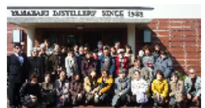
サントリー山崎蒸留所にて

最初に訪れた大阪千日前の“デザインポケット”では食品サンプル製作を体験。出来上がったフルーツタルトは本物そっくりで、「おいしそう」との声が上がっていました。次にNHK連続テレビ小説マッサンで注目の“サントリー山崎蒸留所”を見学。お酒の香り漂う工場内で生産設備や製造工程をご説明いただいた後は、シングルモルトウイスキー山崎などの試飲があり、参加者は短い時間でしたが何杯もおかわりされていました。最後の“京都水族館”では、関西の水族館初の3Dプロジェクトマッピングを鑑賞し、「すごくきれい」と感嘆の声が上がっていました。