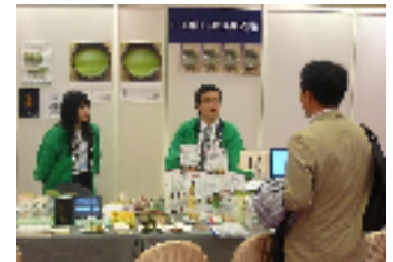
宇治物産PRコーナー