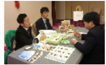
個別商談コーナー

現地参加された3社は、模擬商談会や香港市場の動向研修会などの事前研修でスキルアップして本商談会に備え、それぞれ10社以上のバイヤーとの個別商談で、約9割が成約見込みや継続交渉など手応えのある商談会となりました。宇治商工会議所では、今後も海外販路開拓を目指す事業者の方を支援してまいりますので、お気軽にご相談ください。